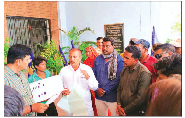
चापडा। ज्ञापन देकर अपनी मांग बताते हुए ग्राम मातमोर के ग्रामीण।