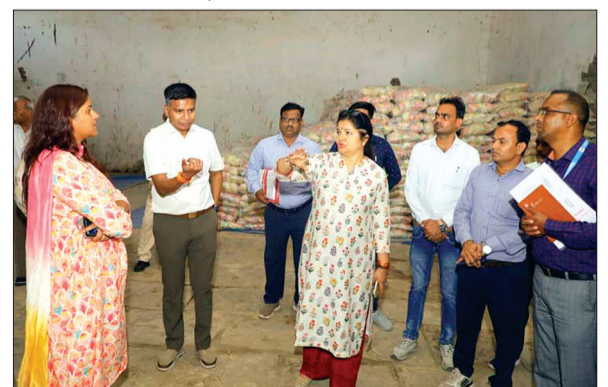
देवास। गेहूं का निरीक्षण करते हुए अपर मुख्य सचिव।